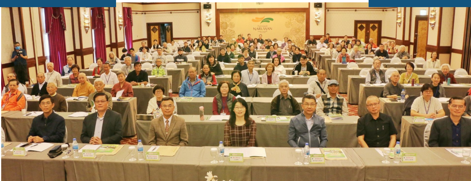
東區9個矯正機關首長及職員帶領各機關之志工，共121位志工共襄盛舉(本次研習大合照)

為 提升矯正機關志工專業知能，增進教化輔導技巧，法務部矯正署武陵外役監獄於112年11月20日(星期一)假臺東娜路彎大酒店盛大舉辦「112年度法務部矯正署所屬東區矯正機關志工組訓」活動，計有來自東區9個矯正機關首長及職員帶領各機關之志工前來共襄盛舉，共121位志工參與本次研習。